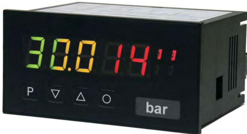
Bsp.: M2 tricolour, digitales 5-stelliges Anzeigergerät mit 14 mm Ziffernhöhe